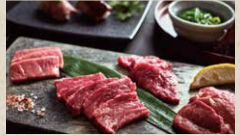
石垣島有名ブランド "石垣牛" セット (一人前)

MENU; Misaki Beef ( Loin, Short Ribs, Lean Meat ) / Agu Pork / Yanbaru Chicken / Beef Tongue / Soft Serve Ice Cream / Salad, Soup, Rice