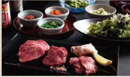
沖縄県産ブランド牛・豚・鶏のセット (一人前)

MENU; Misaki Beef Lean Meat / Agu Pork / Soft Serve Ice Cream / Salad, Soup, Rice