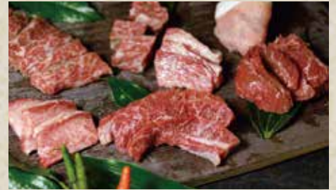
石垣島ブランド和牛

美崎牛 (100g) / 焼き野菜 Misaki Beef (100g) / Vegetables