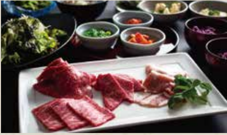
ブランド和牛 美崎牛の食べ放題セット (一人前)