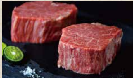
地産和牛 盛り合わせ